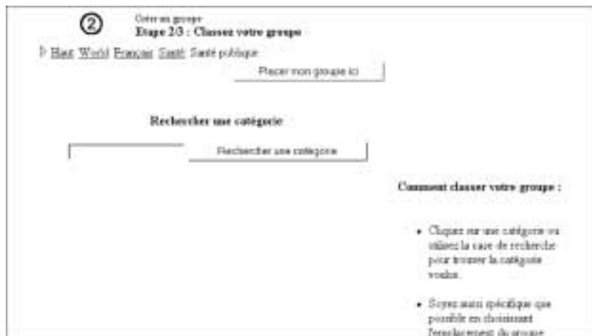
Figure 126 : La catégorie santé publique nous convient. Nous appuyons sur placer mon groupe ici .