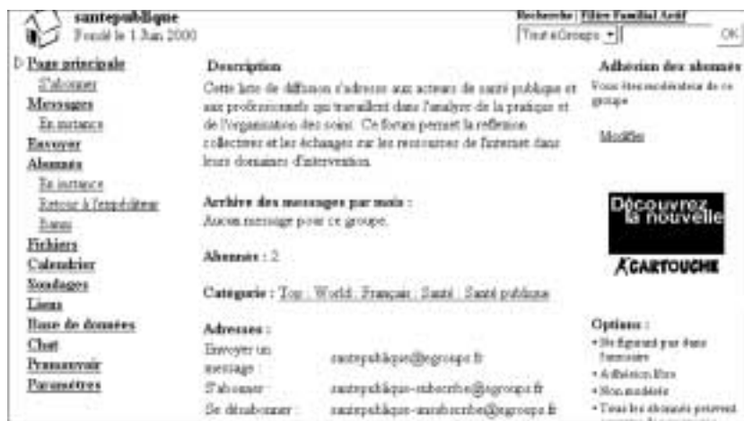
Figure 129 : La page principale de notre liste de diffusion.

Nous cliquons sur santepublique : page principale :