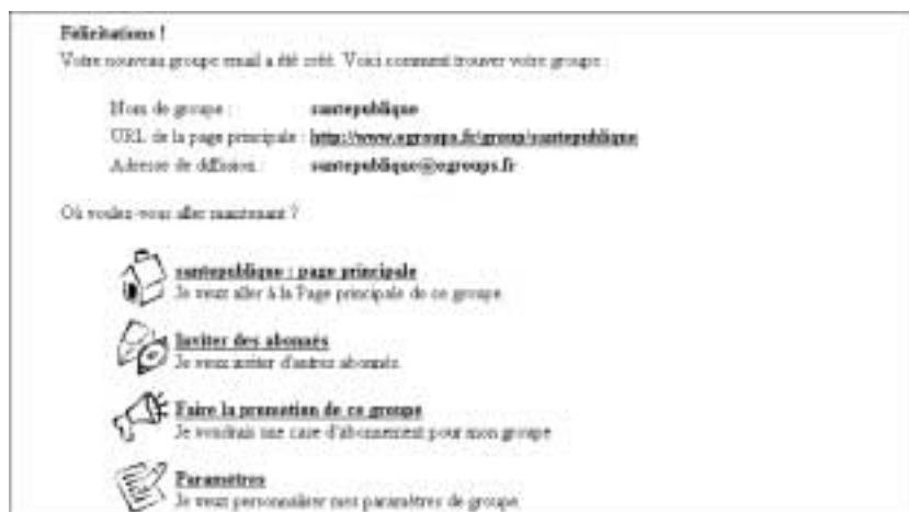
Figure 128 : Nous allons maintenant à la page principale.

Nous cliquons sur santepublique : page principale :