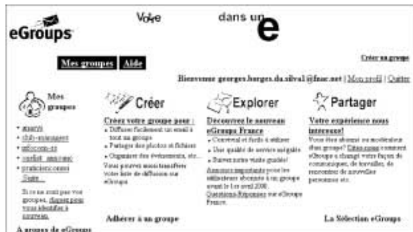
Figure 123 : L'accueil de Egroups.

Il est possible qu'après cette manœuvre, le serveur vous demande de vous identifier et de choisir un mot de passe. N'hésitez pas à le faire.